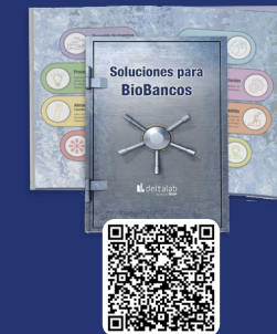
Catálogo Soluciones para Biobancos