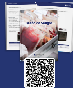
Catálogo Banco de Sangre