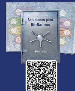
Catálogo Soluciones para Biobancos